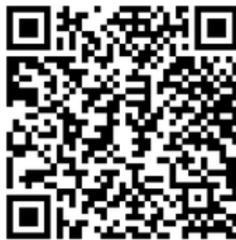
QR code เกียรติบัตรครู

8. QR code หรือ link แหล่งเก็บข้อมูล เกียรติบัตร ของครูและนักเรียน ( กรุณาตรวจสอบให้แน่ใจว่า QR code หรือ link ที่ท่านแนบ สามารถใช้งานได้ ก่อนส่ง)