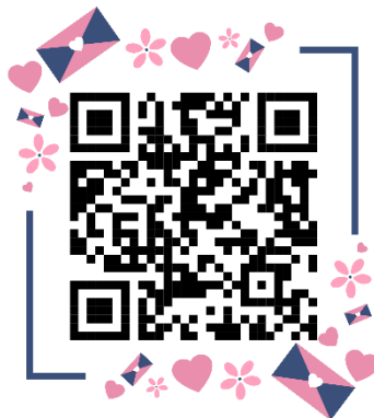
QR code เกียรติบัตรครู

8. QR code หรือ link แหล่งเก็บข้อมูล เกียรติบัตร ของครูและนักเรียน ( กรุณาตรวจสอบให้แน่ใจว่า QR code หรือ link ที่ท่านแนบ สามารถใช้งานได้ ก่อนส่ง)