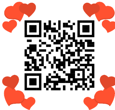
QR code เกียรติบัตรนักเรียน