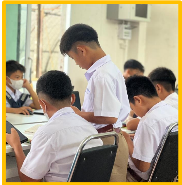
นักเรียนเข้าเรียนบทเรียนออนไลน์หลักสูตรอุ้นใจไซเบอร์