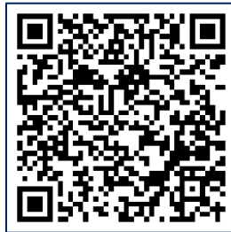
คิวอาร์โค้ดเกียรติบัตรผ่านการอบรมของคณะครู

7. ข้อเสนอแนะ (เพื่อการปรับปรุงคุณภาพของการดำเนินงานโครงการฯ)