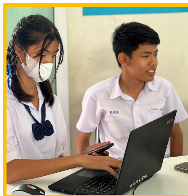
นักเรียนเข้าเรียนบทเรียนออนไลน์หลักสูตรอุ่นใจไซเบอร์