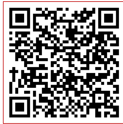
เกียรติบัตรครู