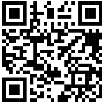
แผนการจัดการเรียนรู้ พลเมืองดิจิทัล (Digital Citizenship)

5. ตัวอย่างแผนการจัดการเรียนรู้ที่นำหลักสูตร “อุ่นใจไซเบอร์” ไปใช้เป็นสื่อการเรียนการสอนเพื่อ ส่งเสริมการเรียนรู้หน้าที่พลเมืองดิจิทัล (Digital Citizenship) ให้กับนักเรียนของสถานศึกษาในสังกัด (อย่างน้อย 1 แผนการจัดการเรียนรู้)